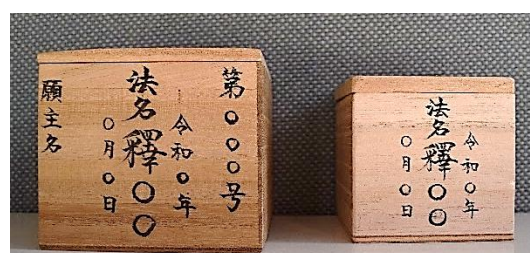
写真左「須弥壇収骨用」 写真右「納骨堂納骨用」